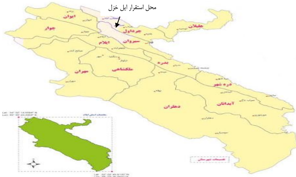
شکل ۱. نقشه محل استقرار ایل خزل

ایل خزل از ایلات بزرگ استان ایلام است که منطقه‌ی بیلاقی آن عمدتاً در بخش آسمان‌آباد و زنجیره در شهرستان چرداول و در بخش کارزان در شهرستان سیروان و منطقه‌ی قشلاق آن در منطقه‌ی جدار مرزی میمک در شهرستان ایلام واقع شده است. این تحقیق نیز در شهر ایلام انجام شده است.